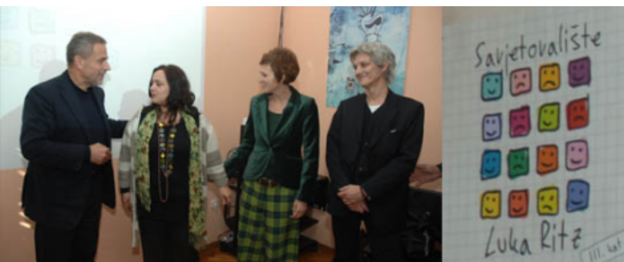
Otvorenje savjetovališta Luka Ritz

Podrškom djeci, mladima i obiteljima u okviru mjera iz svoje zdravstvene politike, Grad Zagreb također osigurava financijsku i organizacijsku podršku radu savjetovališta za djecu, mlade i obitelj.