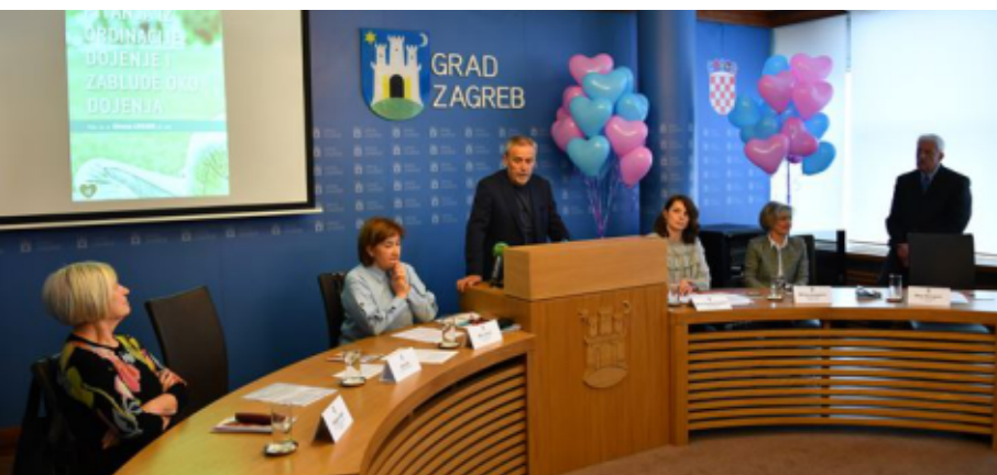
Predstavljanje Priručnika za dojenje

Iz proračuna Grada Zagreba godišnje se izdvaja više od 3.300.000,00 kn za 22 savjetovališta, a za više od 40 programa i projekata organizacija civilnog društva više od 1.600.000,00 kn.