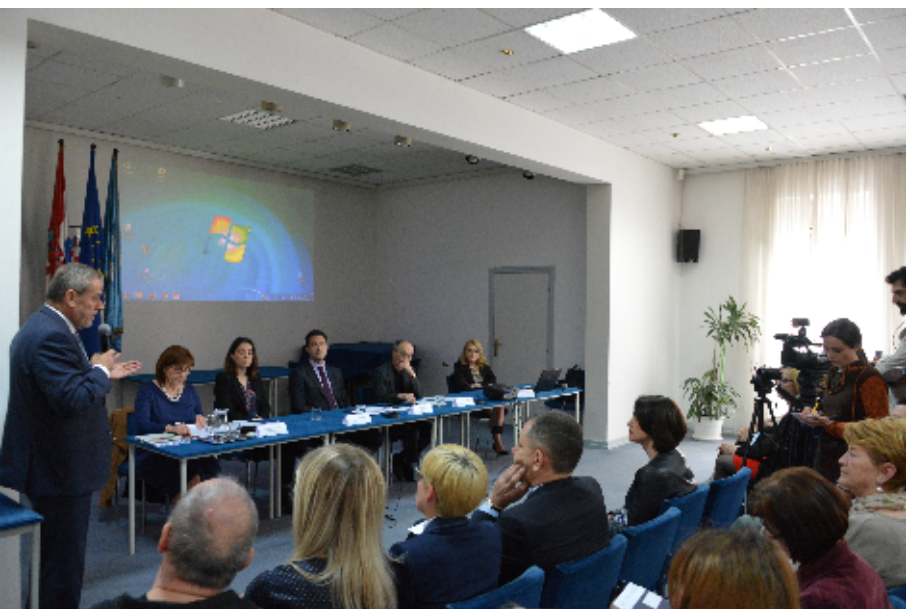
Okrugli stol o pronatalitetnoj politici Grada Zagreba na kojoj je predstavljen Projekt roditelj odgojitelj

Grad Zagreb za ovu mjeru izdvaja po korisniku 7.106,99 kn mjesečno, a roditelj odgojitelj može mjeru koristiti do navršene 15 godine života djeteta.